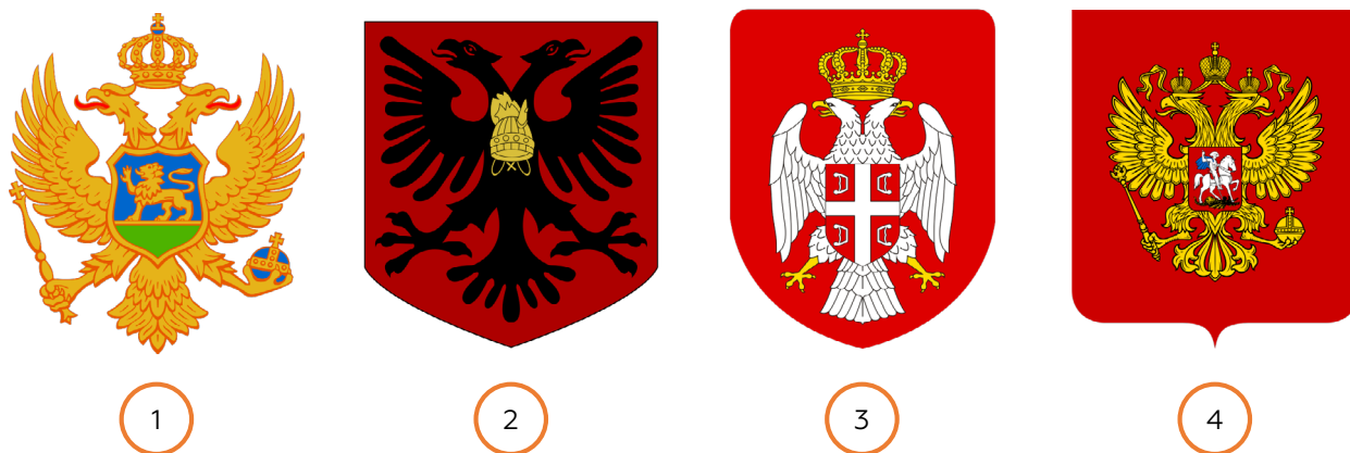
Рисунок 2 – Игра «Найди герб России»