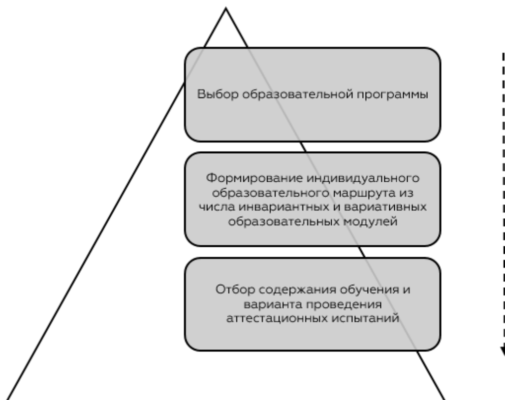
Рисунок 2 – Модель реализации принципа вариативности в системе дополнительного профессионального образования: опыт Калининградского областного института развития образования

Калининградский областной институт развития образования приобрел опыт внедрения принципа вариативности в практику дополнительного профессионального образования тремя путями / вариантами (рисунок 2). Рассмотрим каждый из них.