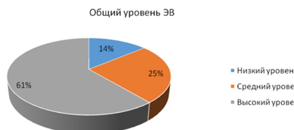
Рисунок 4 – Общий уровень эмоционального выгорания учителей Гимназии г. Гурьевска

Ниже на рисунке 4 представлены обобщенные данные по общему уровню эмоционального выгорания учителей, который был определен путем анализа всех трех шкал методики К. Маслач и С. Джексона. Можно сделать вывод, что большая часть испытуемых имеет высокий уровень эмоционального выгорания (61 %). Средний уровень эмоционального выгорания имеет 18 человек (25 %), низкий уровень имеют 10 учителей (14 %).