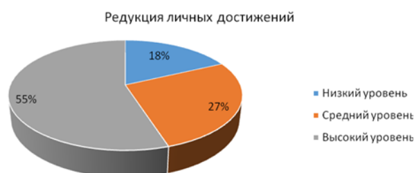
Рисунок 3 – Уровень редукции личных достижений учителей Гимназии г. Гурьевска

достижений учителей Гимназии г. Гурьевска: 55 % учителей имеют высокий уровень редукции личных достижений, средний уровень по данной шкале присутствует у 19 испытуемых, и это 27 % от всех принимавших участие в эмпирическом исследовании учителей; низкий уровень редукции личных достижений лишь у 13 человек, или у 18 %.