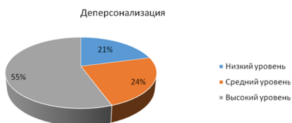
Рисунок 2 – Уровень деперсонализации учителей Гимназии г. Гурьевска

Согласно полученным данным, большая часть учителей Гимназии г. Гурьевска имеет высокий уровень деперсонализации (55 %). Средний уровень имеет 24 % опрошенных учителей (17 человек) и 15 человек (21 %) имеет низкий уровень деперсонализации (рисунки 2).